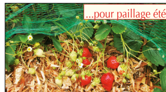
...pour paillage été