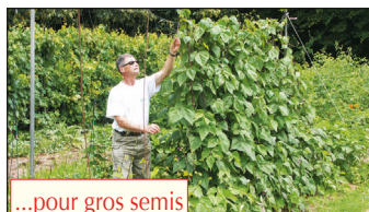
...pour gros semis

« Ce foin dont vous couvrez la terre contient de millions de graines : écartez ce mulch pour semer, et c'est aussitôt « l'explosion » des graines indésirables. : semées ainsi, les minuscules levées de carottes, thym, salades... devront être méticuleusement sarclées ».