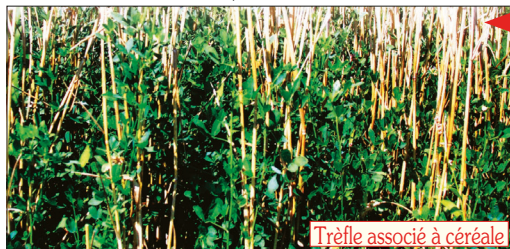
Trèfle associé à céréale

Les bienfaits de l’association de couverts se retrouvent dans l’association de cultures : espèces et variétés peuvent être mélangées au bénéfice de la résistance et de la productivité. Les exemples se multiplient, en de nombreuses pratiques, chaque année plus ingénieuses.