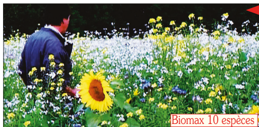
Biomax 10 espèces

Et parallèlement à ces 5 piliers, des innovations sont arrivées . De nouveaux matériels sont proposés par des firmes et parfois “autoconstruits”. De nouvelles espèces et variétés de cultures et de couverts sont obtenues par des semenciers, et testées par des agriculteurs et éleveurs. Et ces “trouvailles” sont échangées en groupements, avec le démultiplicateur que sont les techniciens, les articles et les DVD. Citons quelques unes de ces trouvailles ou simplement de tendances :