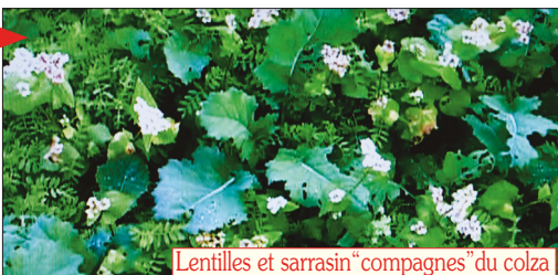
Lentilles et sarrasin “compagnes” du colza