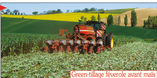
Green-tillage féverole avant maïs

Les associations de couverts végétaux “explosent” en des “ Biomax ”, foisonnement de racines et de masse aérienne, mulchée et jamais enfouie. Et d’autres “ boosters biologiques ”, les Méteils , sont traditionnels ou re-composés en rotations fourragères à tonnages records en MS et en “ autofertilisant ”.